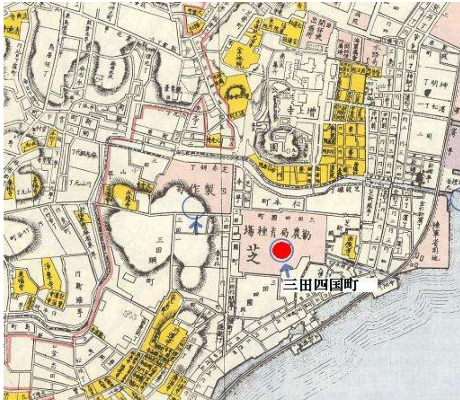
図-2 三田四国町 明治11年

ここには、勸農局育種場があり、西洋式農業技術の導入と種苗を増殖して全国に配布することを試みていて、明治18年には閉鎖されたそうです。愚考するに、おそらくこの跡地に水産伝習所を建てたのではないのでしょうか。水産伝習所の写真が残っています。広い敷地に2階建ての校舎があり、この辺りでは目立つものだったかもしれません。