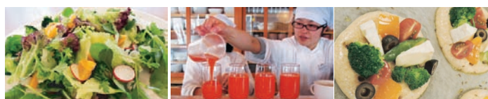
お野菜たっぷりサラダ 無農薬人参ジュース 絶品!!フォカッチャ